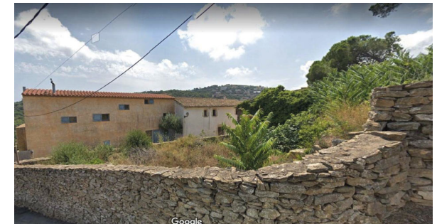
Vista desde la calle Doctor Pericot