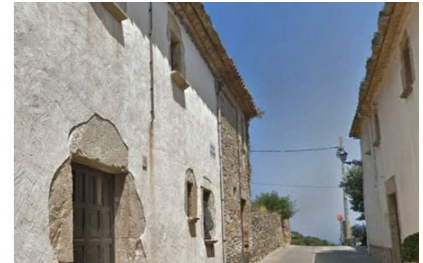
Vista desde la calle Sant Antoni