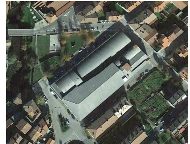
Vista aérea parcela con edificación existente