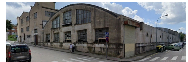
Vista esquina c/ Pintor Ramón Barnades y Av Bisaroques