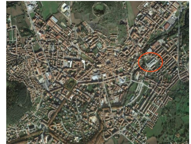
Emplazamiento de la parcela

Tlf contacto servicios técnicos: 669373282